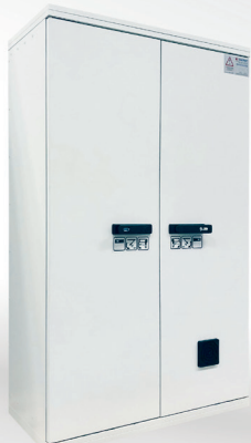
Violution MODUS 90