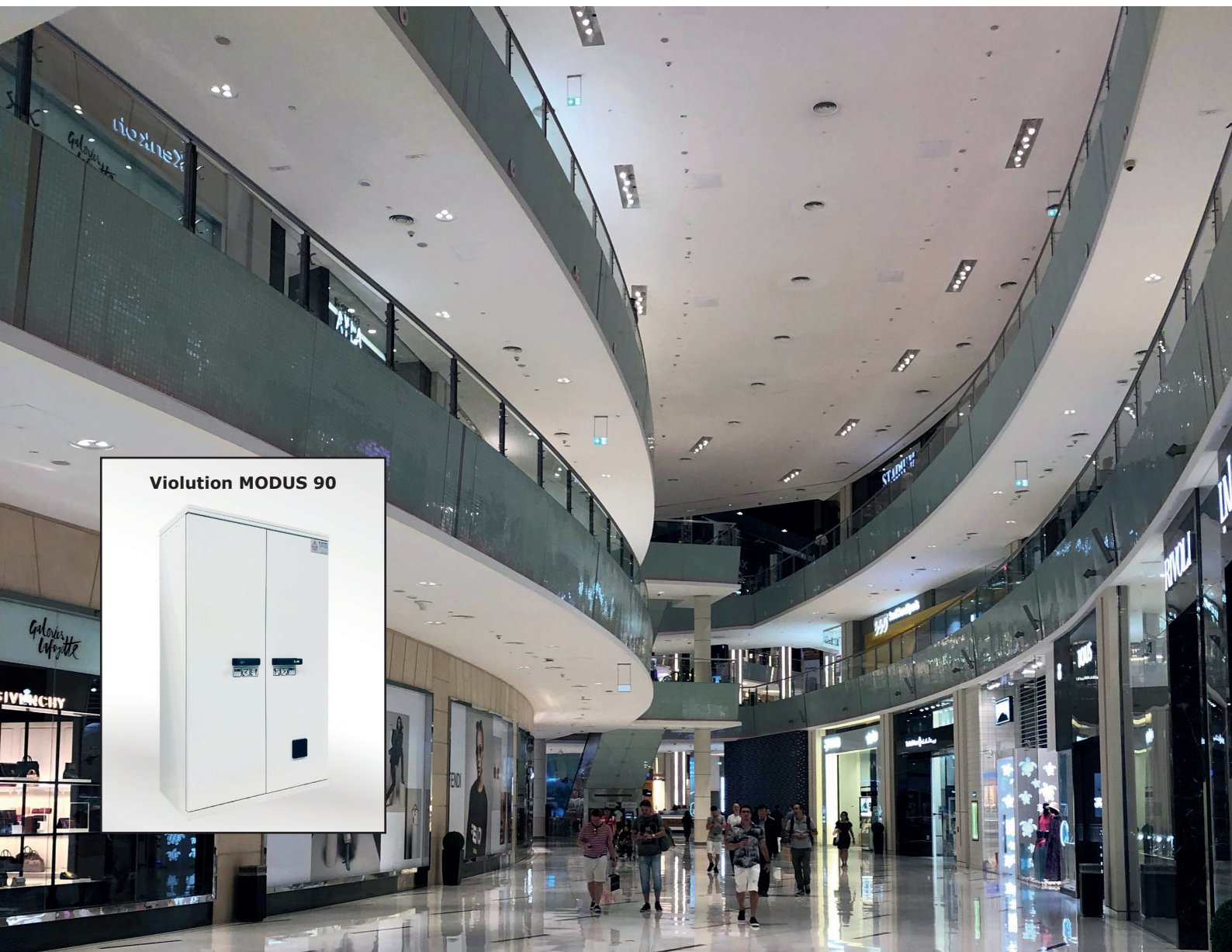
Violution MODUS 90