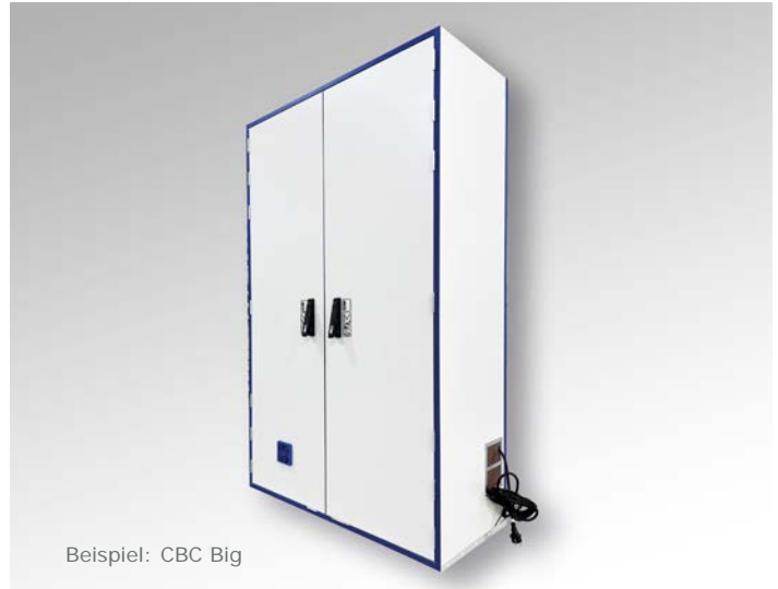
Beispiel: CBC Big