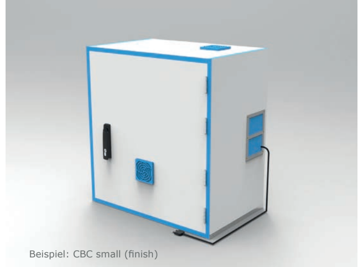
Beispiel: CBC small (finish)