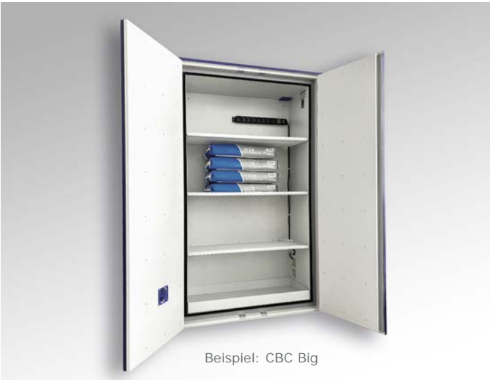
Beispiel: CBC Big